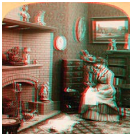
Рисуюнок А.7 Приклад зображення створеного англiфiчним друком

АНАГЛІФІЧНИЙ ДРУК, СТЕРЕОСКОПІЧНИЙ ДРУК (від гр. Anaglyphos — рельєфний). Спосіб відтворення об'ємних зображень на площині поліграфічними засобами. Суть його полягає у виготовленні двох зображень одного об'єкту, сфотографованого з двох точок. Обидва зображення друкують на одному аркуші, кожне своєю фарбою (синьою і червоною) і з лінійним зсувом один щодо одного (рис. А.7). Розглядають отриманий дво-