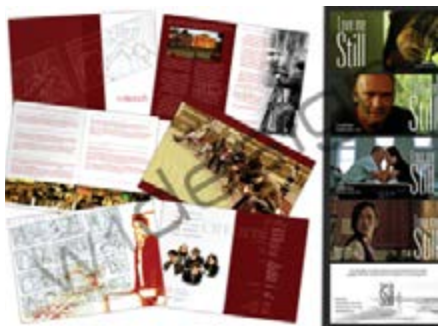
Рисунок Б.8 Приклади буклетів

БУКЛЕТ (від англ. Booklet — книжечка). Не-періодичне листове видання, надруковане з обох сторін аркуша й сфальцьовані будь-яким способом в два і більше згини.