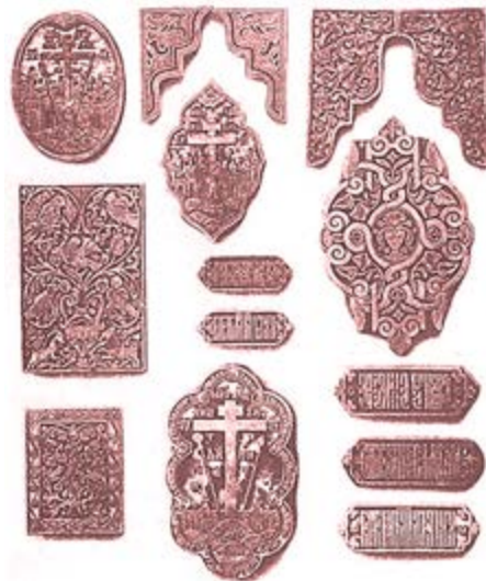
Рисунок Б.2 Басми

БАСМИ (від тюрк. Басма — відбиток). Металеві штампи невеликого розміру, що застосовувалися для ручного тиснення орнаментальних візерунків на палітурках.