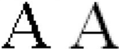
Рисунок А.11 Антиалізінг

бів боротьби з небажаним спотворенням контуру. При відтворенні шрифту зубчики на контурі можуть бути мінімізовані за допомогою застосування точок різних рівнів сірого контуру по краю. Тоді зубчастий контур як би розмивається по екрану і набуває видимість гладкою лінією.