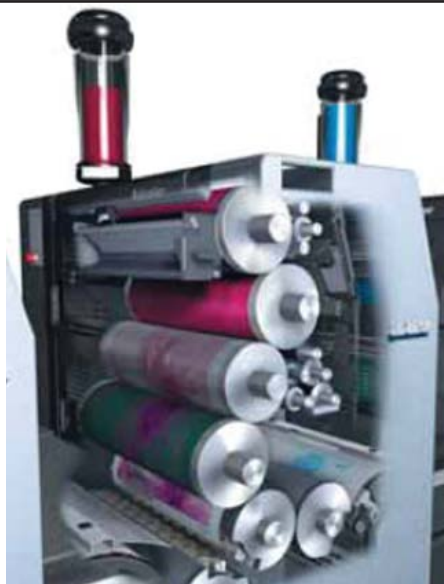
Рисунок А.9 Анілоксівий фарбуючий апарат

АНИЛОВИЙ ДРУК. Різновид високого друку. Провадиться за допомогою еластичних (гумових) кліше, виготовлених способом вулканізації і змонтованих на друкувальних циліндрах, кількість яких дорівнює кількості фарб. Фарба являє собою розчин штучних органічних барвників у суміші оцтової к-ти, води і спирту. Вона прозора, плинна, як чорнило, і швидко сохне. Завдяки цьому одночасно можна друкувати 6 і більше фарб. В аніловоому