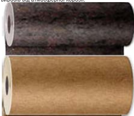
Рисунок А.12 Антикорозійний папір

АНТИКОРОЗІЙНИЙ ПАКУВАЛЬНИЙ ПАПІР ( Corrosion proof wrapping paper ). Папір з водостійким покриттям, іноді без нього, що містить інгібітори корозії і призначений для захисту металевих виробів від атмосферної корозії.