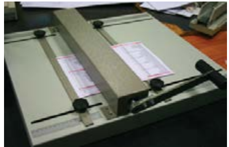
Рисуюнок Б.3 Бігувальна машина

БІГОВКА (від нім. Biegen — гнути, згинати). Попереднє нанесення на матеріал ліній згинів за допомогою тупих дискових ножів або планками в бігувальних машинах, які вдавлюють і ущільнюють матеріал з частковим руйнуванням зв'язків у волокнистих матеріалах. Здійснюється на спеціальних машинах. Від фальцювання відрізняється дещо іншою (більш яскраво вираженою) лінією згину, а також можливістю здійснення даного процесу на більш щільних матеріалах. Біговка необхідна для здійснення якісних згинів готової поліграфічної продукції.