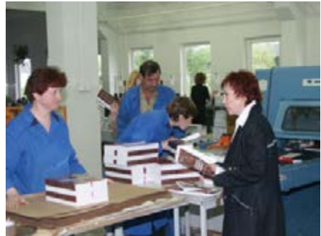
Рисунок Б.6 Брошуровально-палітурний цех

БРОШУРУВАЛЬНО-ПАЛІТУРНІ ПРОЦЕСИ . Завершуючі поліграфічне виробництво процеси, що призводять до отримання з віддрукованих листів зошитів, видань, брошур, журналів або книг в обкладинці або палітурці. Включають фальцювання, підбір, шиття, або безшвейне скріплення книжково — журнальних зошитів, криті обкладинкою та ін.