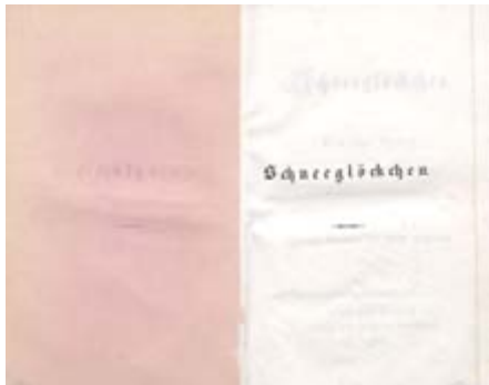
Рисунок А.2 Приклад авантитула

АВАНТИТУЛ (від фр. avant — перед і лат. titulus — напис, заголовок). Перша сторінка подвійного титульного аркуша. Дозволяє розвантажити основний титульний лист. На авантитулі зазвичай розміщують надзаголовочні дані, іноді — вихідні дані, видавничу марку, прізвище автора і заголовок. Інша назва авантитула — фортитул .