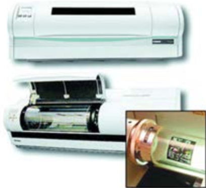
Рисунок Б.1 Барабанный сканер

БАРАБАНИЙ СКАНЕР. Сканер, в якому оригінал встановлюється на зовнішній поверхні циліндра, що обертається. Основна перевага цих сканерів перед площинними (планшетними) — висока швидкість сканування і універсальність (скануван-