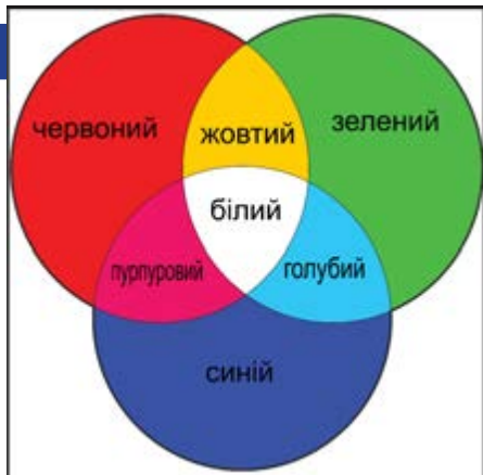
Рисунок А.4 Адитивний синтез кольору

кольорових зображень на екрані, а також при автоматичному синтезі кольору в поліграфії.