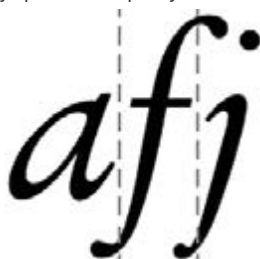
Рисунок Б.4 Бокове звисання

БОКОВЕ ЗВИСАННЯ, КЕРН ( Kern ). У ручному металевому наборі — частина знаку, що заходить у внутрішній простір іншого знаку. Особливо часто застосовувалося в курсиві для додання набору правильного ритму.