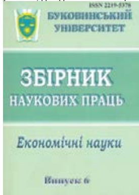
Рисунок Б.10 Бюлетень наукових праць

БЮЛЕТЕНЬ (від фр. bulletin — записка, листок). Оперативне періодичне або продовжуване видання, що містить збори офіційних матеріалів наукового, довідкового і / або рекламного характеру.