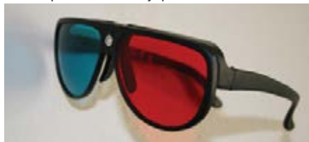
Рисуюнок А.8 Спеціальні окуляри для перегляду стереоскопiчного зображення

колірний відбиток через кольорові окуляри (для кожного ока свій колір (рис. А.8)). Сумарне зображення на відбитку сприймається об'ємним коричнево-чорним на світлому фоні.