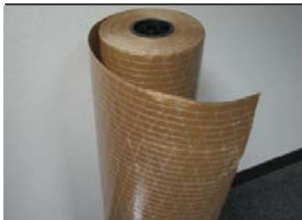
Рисунок А.14 Армований папір

АРХІТЕКТОНІКА КНИГИ (від грец. architektonike — будівельне мистецтво). Візуальна, виражена в художньому оформленні видання, логічно-смыслова структура тексту. Архітектоніка властива будь-якому художньому твору, вона виражається в логічній співвідпорядкованості його частин. Архітектоніка книги проявляється насамперед у рубрикації: більш важливе за змістом має бути і більш помітним зорово. У результаті логічна підпорядкованість текстових блоків знаходить ритмічно-просторову форму. Для цього використовуються: титул, шмуц-титул, спускові смуги, ілюстрації (заставки, кінцівки та ін), а також титульні і текстові шрифти.