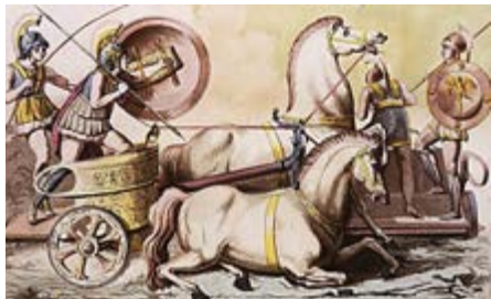
Рисунок А.5 Приклад гравюри створеної за технологією акватинти

АКВАТИНТА (італ. aqua — вода, tinta — відтінок). Вид поглибленої гравюри, отриманої травленням кислотою металевієї пластини. Відбиток гравюри (рис. А.5) в цій манері нагадує малюнок водяними фарбами — аквареллю, це подібність і зумовило походження найменування. Малюнок,