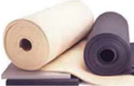
Рисунок А.10 Антиадгезійний папір

АНТИАЛІЗІНГ ( Anti-aliasing ). Один із спосо-