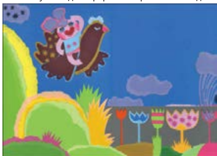
Рисунок А.13 Аплікація

АПЛІКАЦІЯ (від лат. Applicatio — прикладання). Отримання плоско-випуклого кольорового зображення з одночасною висічкою по контуру малюнка тонкої забарвленої непрозорої полімерної плівки. Застосовується для оформлення рекламних видань.