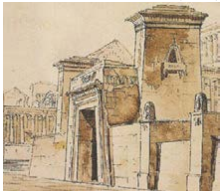
Рисунок А.1 Приклад абрису будівлі

АБРИС (нім. Abriss — контур) — просте, лаконічне зображення предмета, будівлі, його загальний вигляд у вигляді ескізу, начерку (рис. А.1).