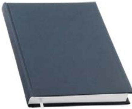
Рисунок Б.9 Обкладинка із бумвінілу

БУМВІНІЛ . Міцний водостійкий палітурний матеріал на паперовій основі з забарвленим полівинілхлоридним покриттям різного кольору, з тисненням або без нього. Бумвініл марки А (80 г/м 2 ) призначений для критих палітурних кришок; марки Б (200 г/м 2 ) — для виготовлення кришок з однієї заготовки.