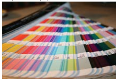
Рисунок А.15 Атлас кольорів Pantone

еталонів. Призначений для визначення (специфікації, аналізу) відтінків кольору предметів за допомогою візуального порівняння їх з еталонними кольорами з атласу в умовах однакового освітлення.