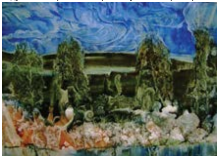
Рисунок А.6 Приклад гравюри створеної за технологією акватипії

АКВАТИПІЯ (грец. aqua — вода, typos — відбиток). Друкування зображень, наприклад, способом високого друку, водною знежиреною (не містить масел) друкарською фарбою. Відбитки нагадують акварель. Використовується в гравюрі.