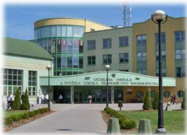
Університет фінансів і бізнесу VISTULA (Варшава)