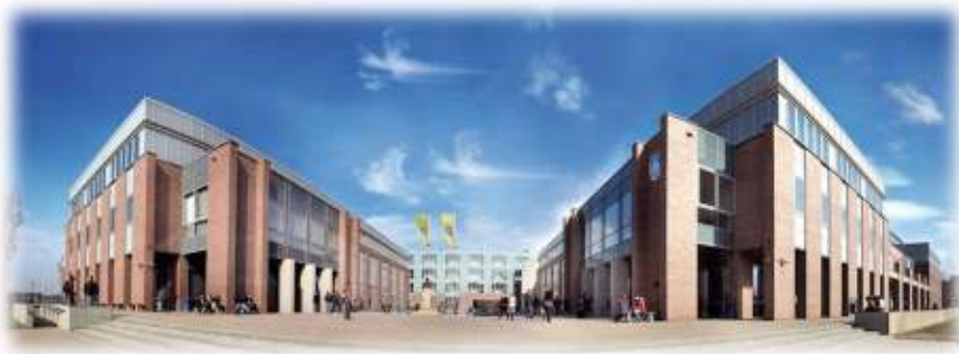
Краківська академія ім.А.Ф. Моджевського