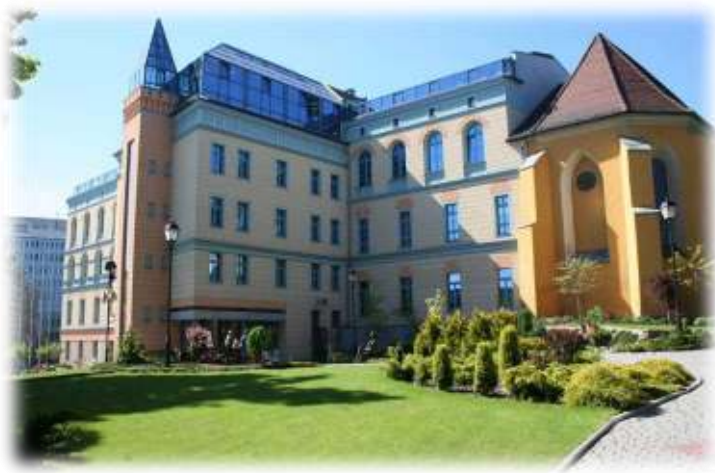
Опольський державний університет (Ополе)