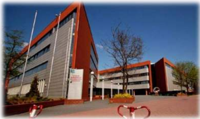
Державний Лодзький університет (Лодзь)