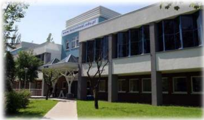
Академія Леона Козмінського (Варшава)