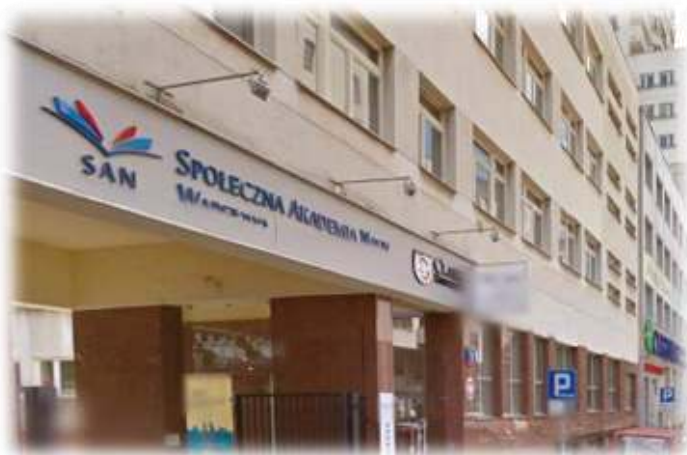
Суспільна академія наук (Варшава)