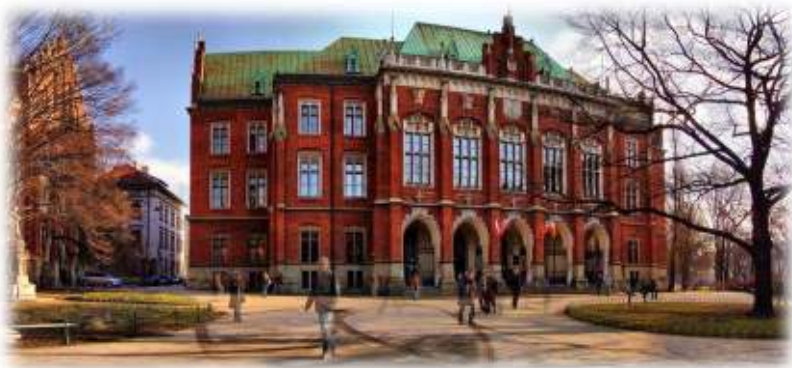
Ягелонський університет (Краків)