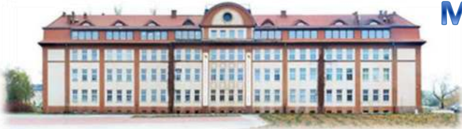
Міжнародна вища школа логістики і транспорту (Вроцлав)