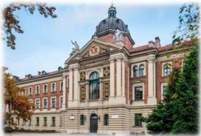
Краківський економічний університет