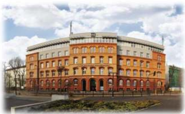
Краківський політехнічний університет