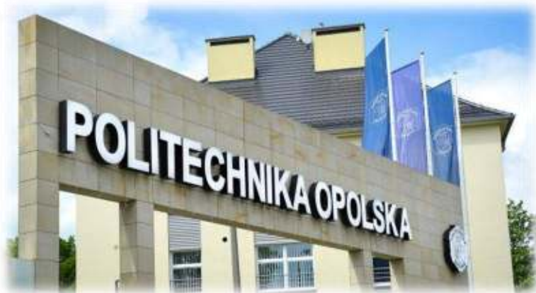
Опольський політехнічний університет (Ополе)