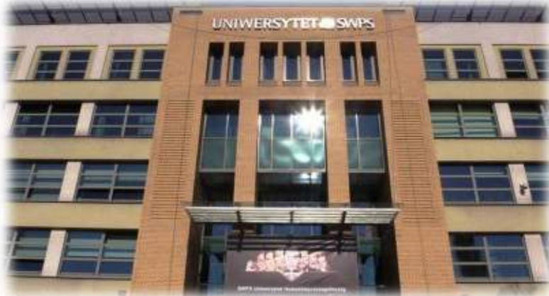
Університет психології (Варшава)