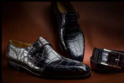
Монки з крокодилової шкіри