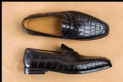
Лофери з крокодилової шкіри