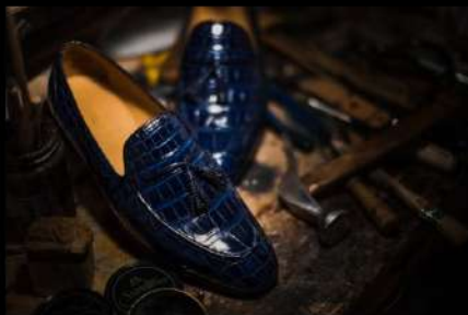
Лофери з крокодилової шкіри