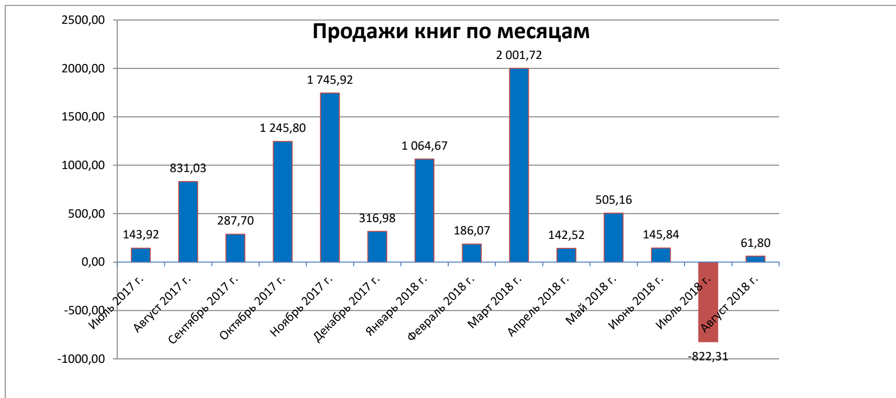
График 1. Продажи книг по месяцам

Исходя из полученных данных, можно сделать вывод, что книги продаются лучше в розницу и мелким оптом с суммой от 100 до 300, чем крупным оптом. Кол-во продаж с чеком более 100$ составило 18 шт. за период с 06.17 по 08.18 включительно. В связи с этим принято решение снизить рекомендованные розничные цены и цены на мелкий опт.