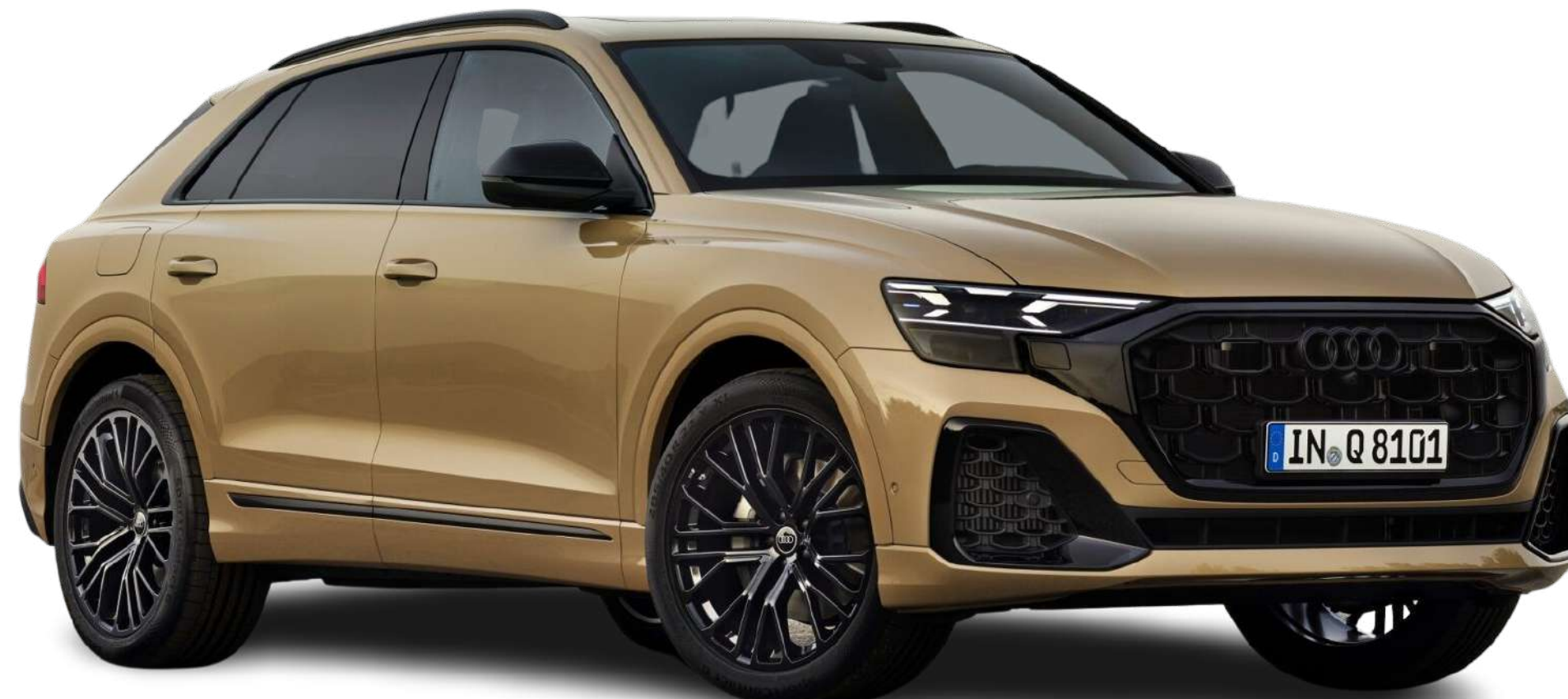
Audi Q8 2024

На вершині лінійки буде знаходитися модифікації Audi SQ8 і RS Q8, перший з турбодизелем а другий з наддувним мотором V8 4.0 потужністю до 600 сил. Для Північно-Американського пізніше буде доступна бензинова варіація моделі SQ8 з 4-літровим бітурбованим V8 потужністю понад 500 сил. Конкурентами Audi Q8 будуть BMW X6 і Mercedes-Benz GLE Coupe.