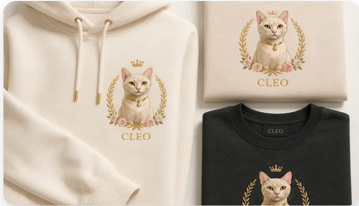
Худі та футболки