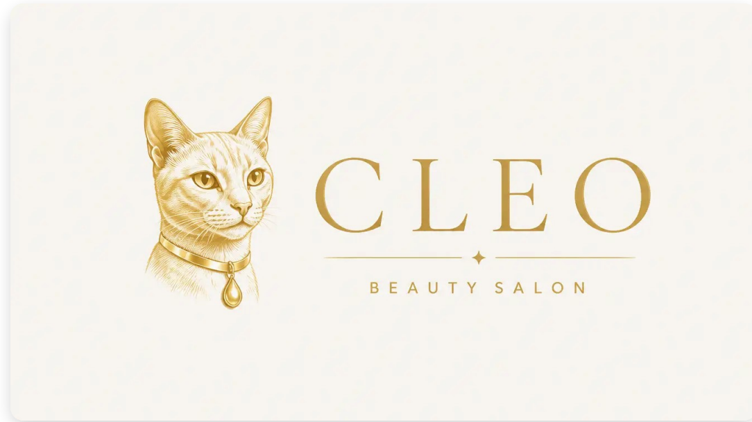
На світлому фоні