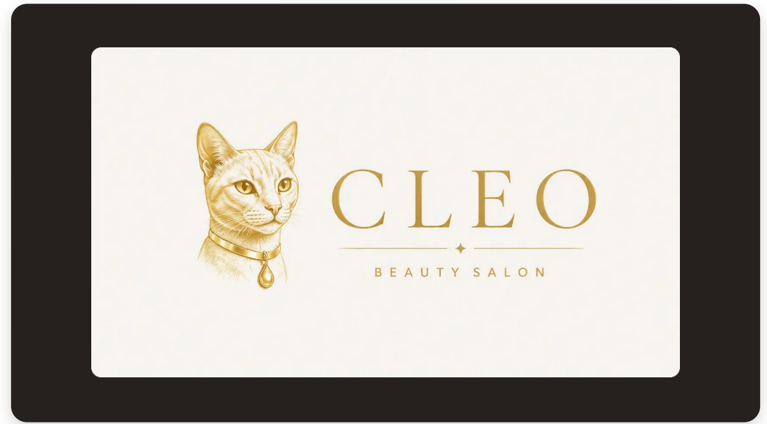
На темних поверхнях — на світлій плашці

Охоронне поле — не менше висоти літери «С» з усіх боків.