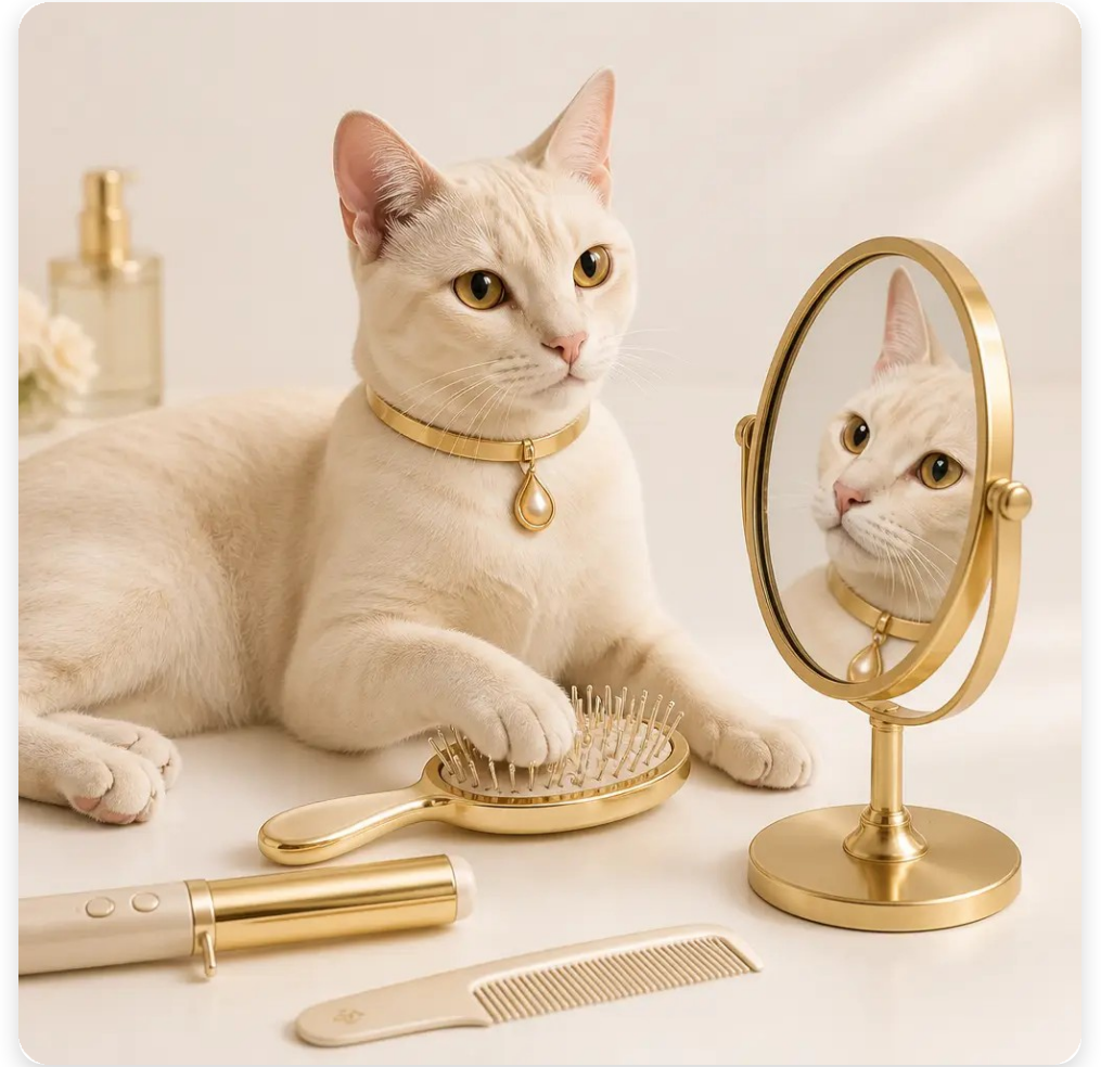
Самодгляд як фірмовий сюжет