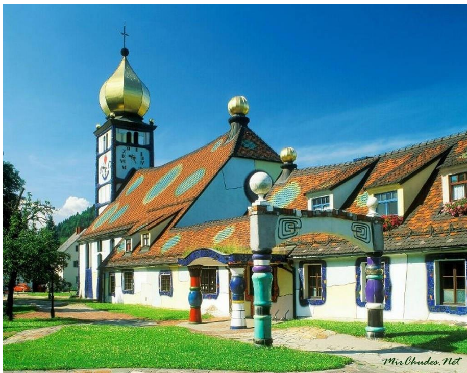
Церковь Святой Варвары в Бернбахе, Австрия