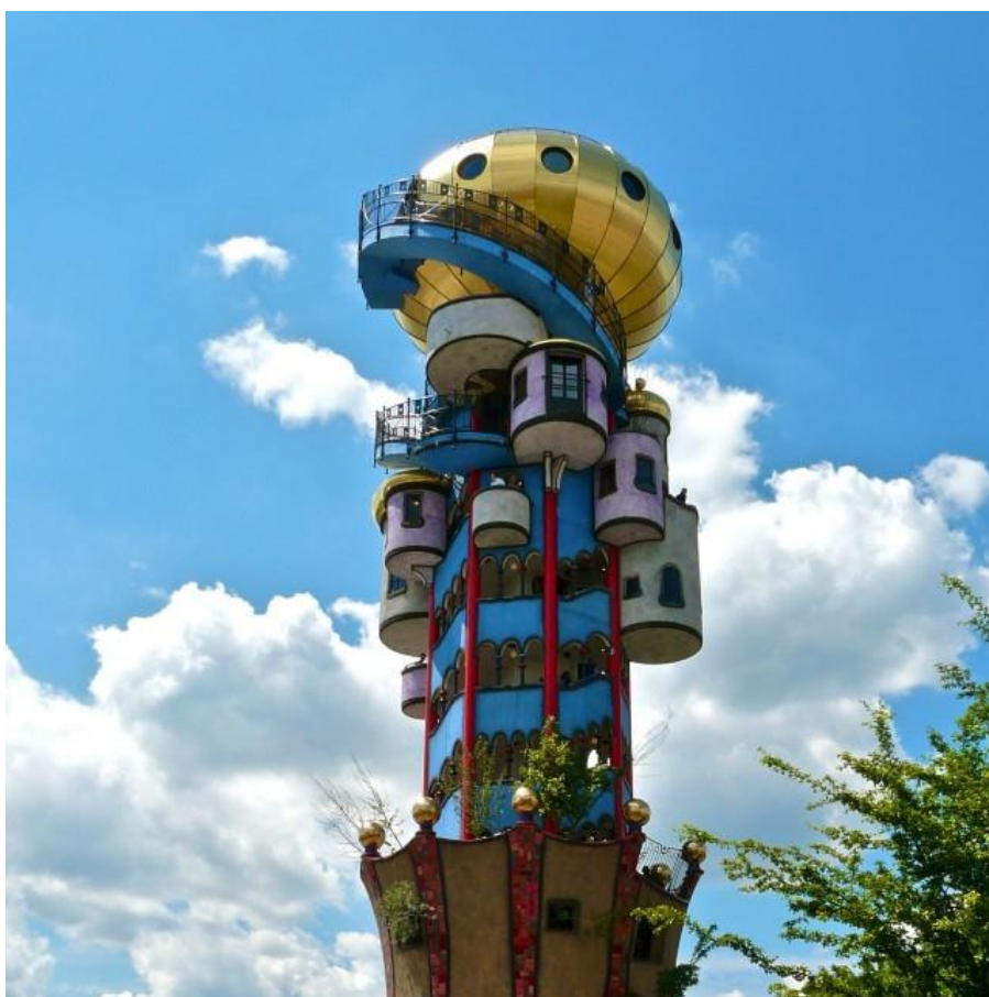
Башня в Абенсберге, Германия