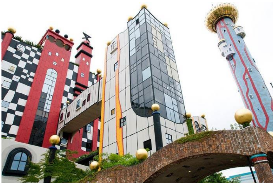
Мусоросжигательный завод в Осаке, Япония

Фриденсрайха Хундертвассера не стало в 2000 году, но огромная популярность даже после смерти доказывает его правоту – люди обожают необычную архитектуру!