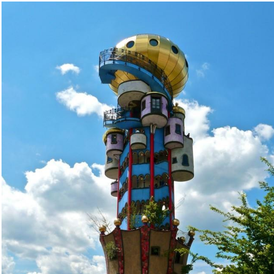
Kuchlbauer Tower in Abensberg, Germany