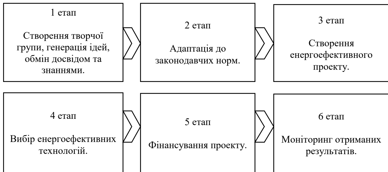
Рис. 3.2. Алгоритм впровадження енергоефективних технологій для ПП «Капітал-Буд сучасне будівництво»

Для розробки і впровадження енергоефективного проєкту у будівництво наступних житлових комплексів, ПП «Капітал-Буд сучасне будівництво» пропонується розбити даний інноваційний процес на етапи, для полегшення сприймання та можливості детального обґрунтування кожного з них (рис. 3.2).