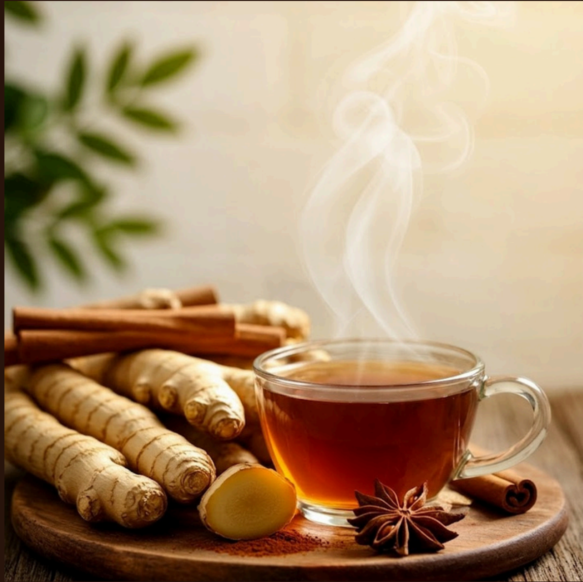
Імбирний чай з медом та апельсином