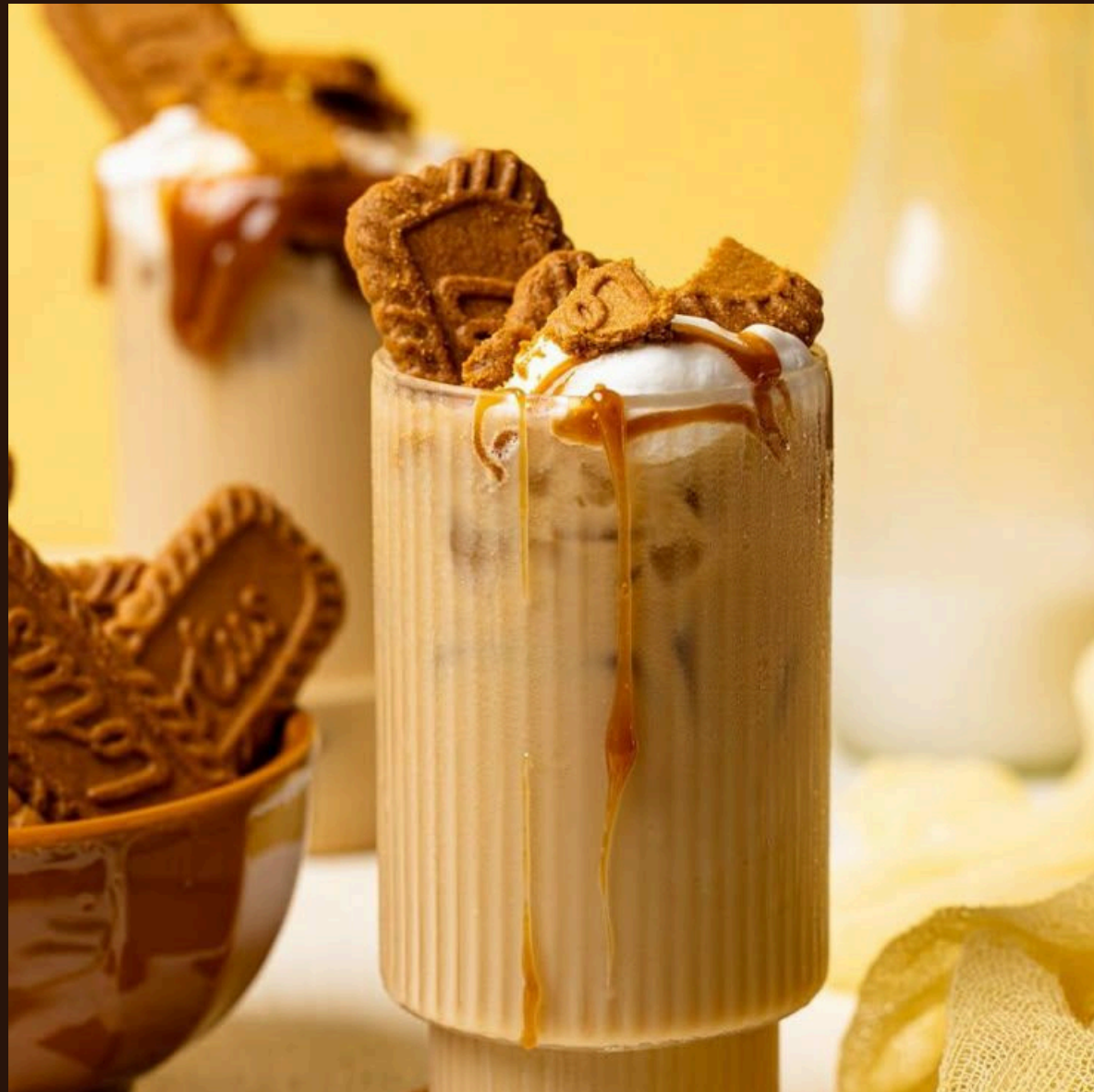
Фраппе — Освіжаючий холодний кавовий напій із льодом та вершками