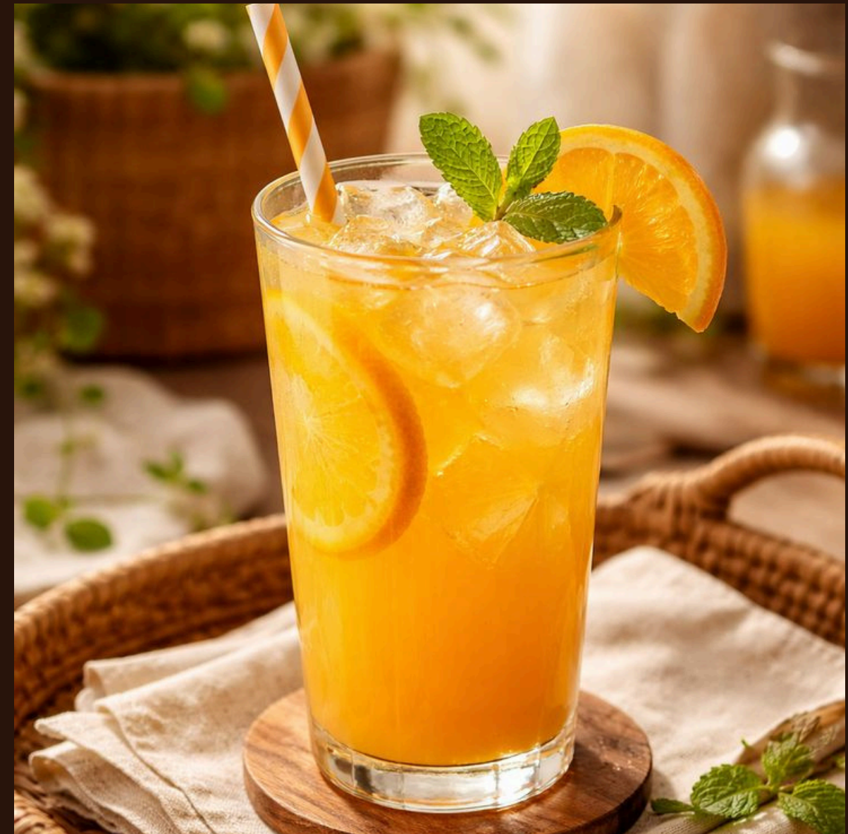
Лимонад — З м'ятою, лаймом та крижаною свіжістю