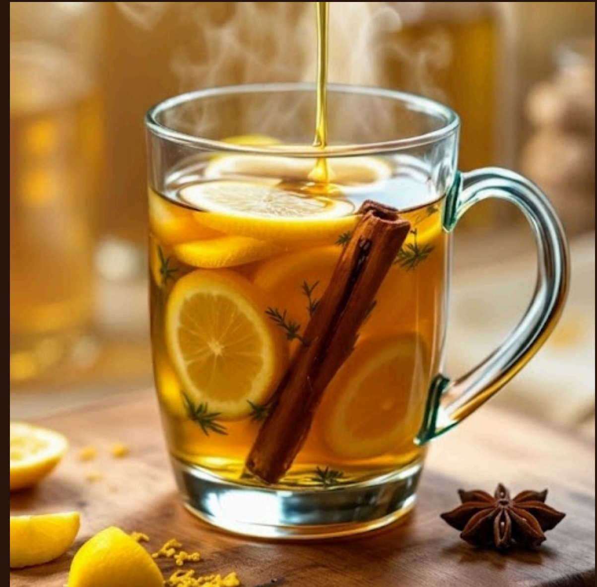
Обліпіха з анісом та корицею