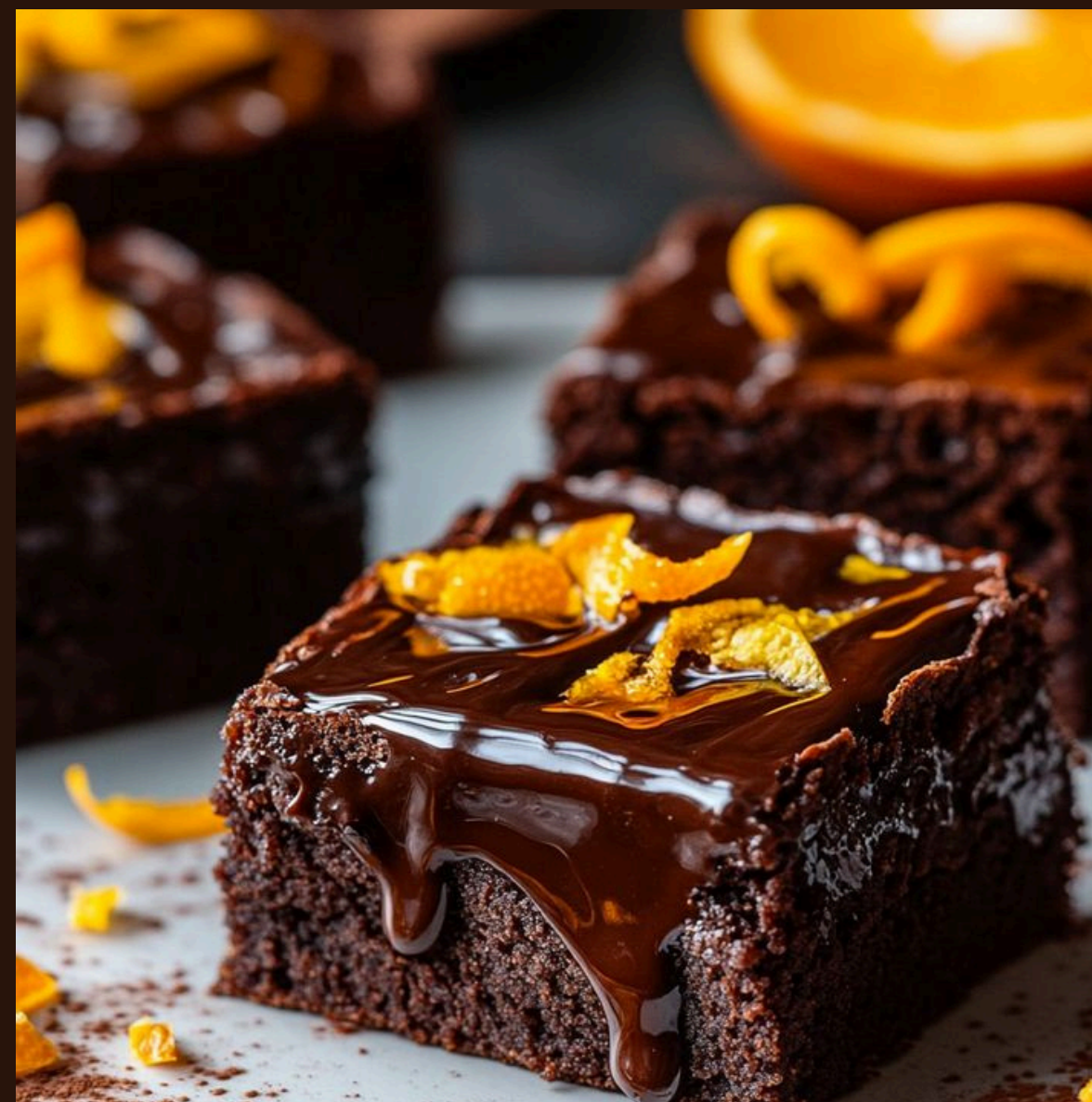
Брауні — Шоколадний із вологою серединкою та горіхами .