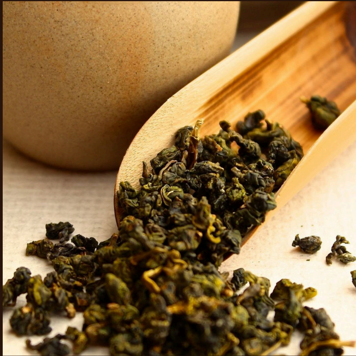
Те Гуань Инь — молочний улун із ніжним квітковим ароматом