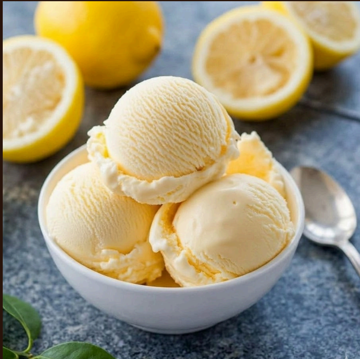
Лимонне — освіжаючий цитрусовий сорбет із кислінкою