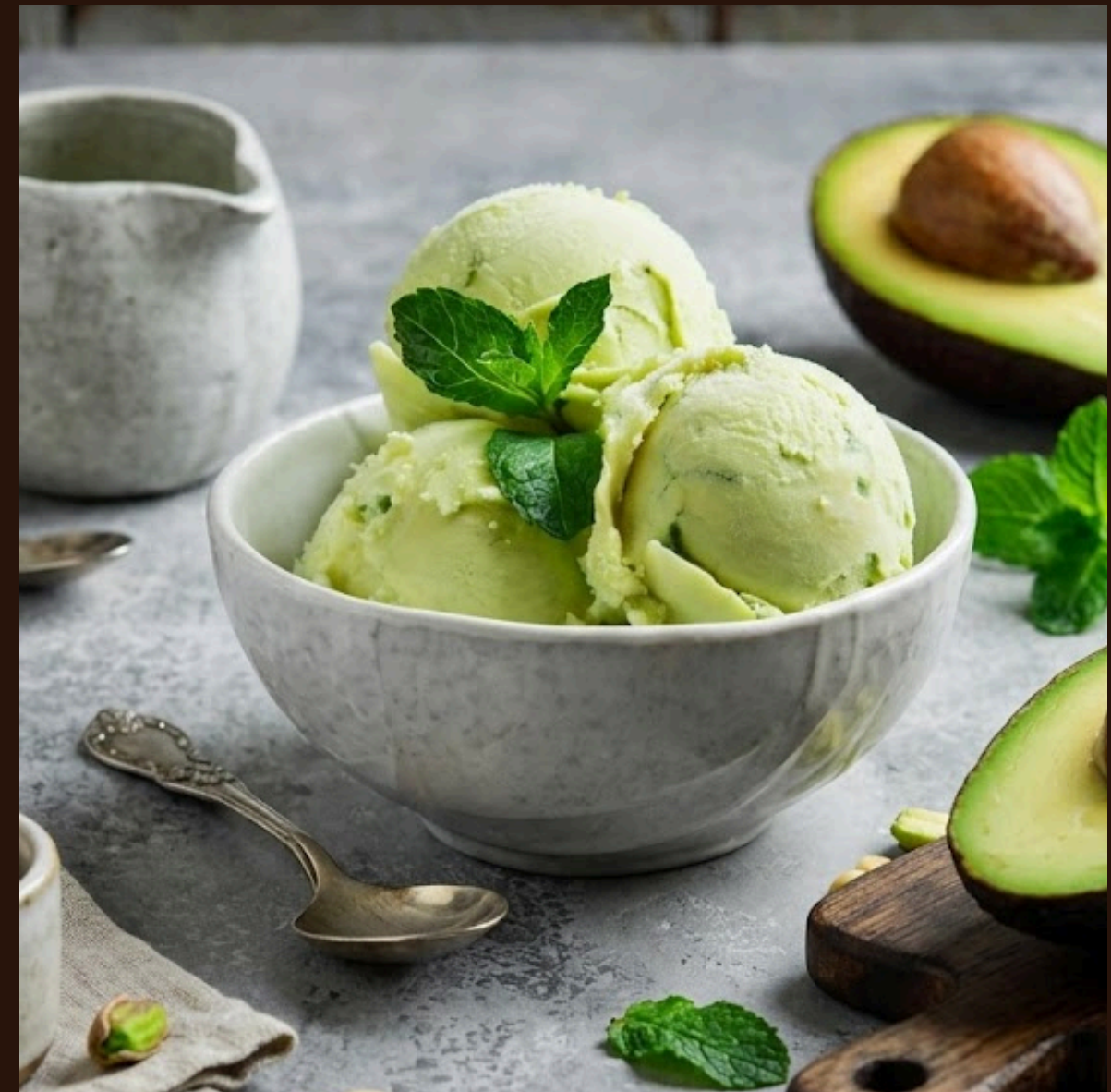
Фісташкове — із смаженими горіхами та вершковою основою