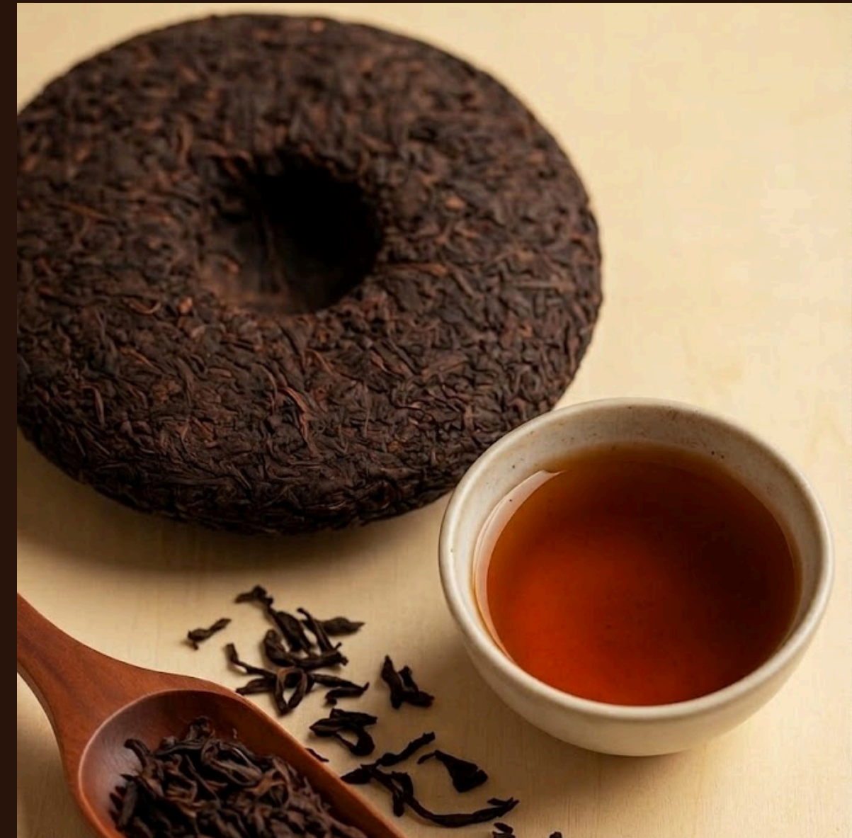
Пуер — насичений, терпкий, із глибоким земляним смаком