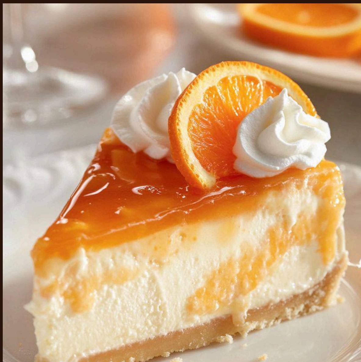
Чизкейк — Ніжний вершковий із апельсиновим соусом.