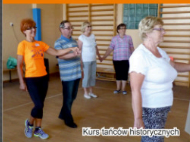
Kurs tańców historycznych