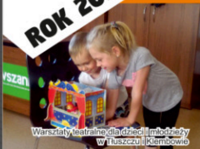
Warsztaty teatralne dla dzieci i młodzieży w Tuszczu i Klembowie