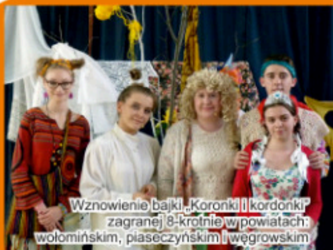
Wznowienie bajki „Koronki i kordonki” zagranej 8-krotnie w powiatach: wołomińskim, piaseczyńskim i węgrowskim