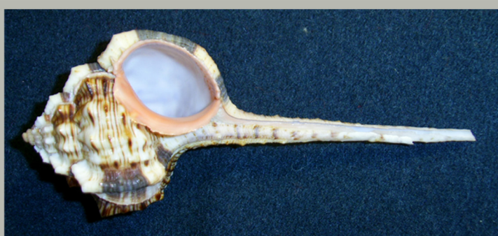
Улитка - бекас

К большому семейству мурексов принадлежат также улитки-бекасы, хикореусы. В определенном положении раковина улитки-бекаса, действительно, очень напоминает голову птицы с большим удивленным глазом и длинным клювом.