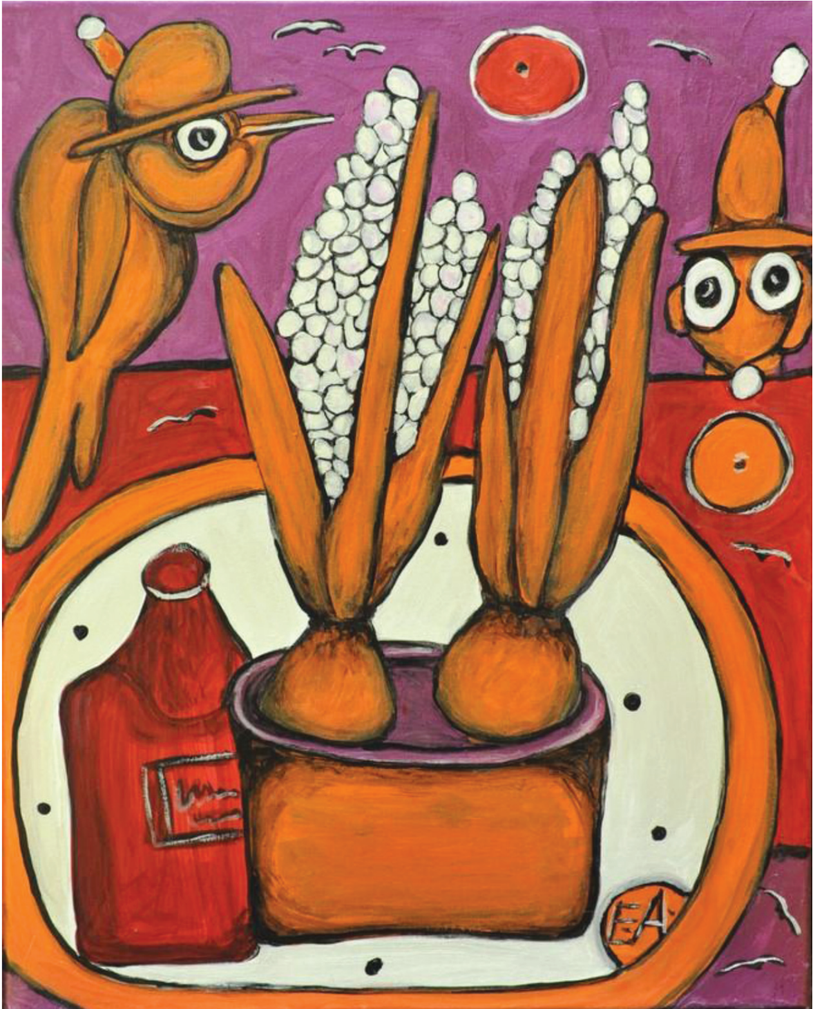
КВІТИ З ПТАХОМ, 2008, 50x40 см, акрил