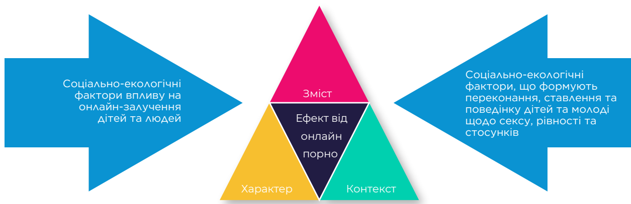
Малюнок 3: Підсумок ключових факторів на вплив порнографії

Це означає, що ініціативи з усунення негативних наслідків порнографії повинні також вирішувати ці перехресні проблеми. Це розглядається в наступному розділі.