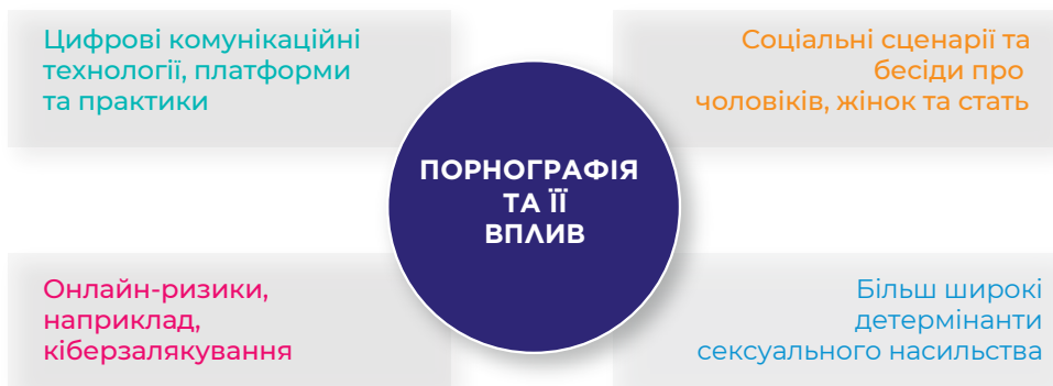
Рисунок 2: Ситуація порнографії та її вплив як проблема