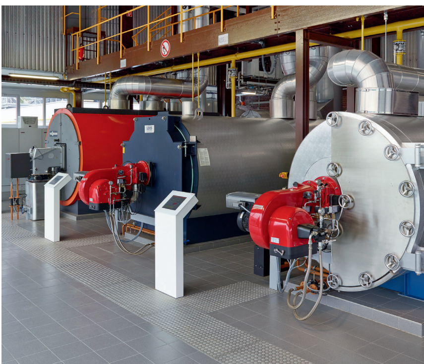
Система управління багатокотловими установками підтверджує свою ефективність на багатьох установках