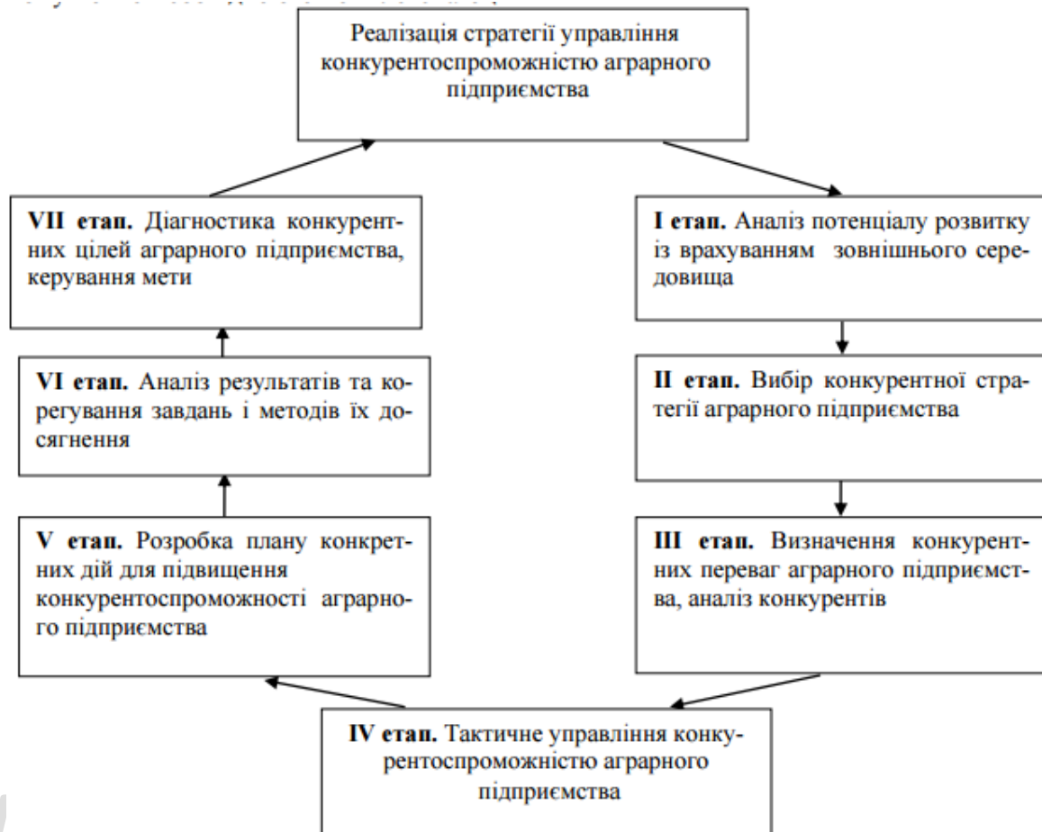
Рис.1 Етапи формування стратегії управління конкурентоспроможністю аграрного підприємства (систематизовано на основі [7, 8])

Структурні трансформації у будь-якій галузі розпочинаються зі здійснення її реорганізації безпосередньо на підприємствах і супроводжуються різними змінами у структурі персоналу та його перепідготовці. При цьому важливу роль відіграє вид організаційно правової форми підприємства (табл. 1).