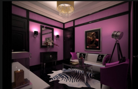
полулюкс Party Room