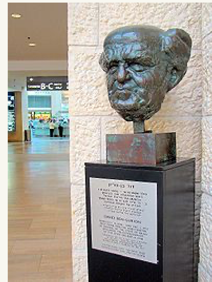
БЮСТ ДАВИДА БЕН-ГУРИОНА ПРИ ВХОДЕ В ТЕРМИНАЛ 3

У ПЕРШИЙ РІК ПІСЛЯ ВІДКРИТТЯ АЕРОПОРТУ ЧЕРЕЗ НЬОГО ПРОЙШЛИ 40 ТИСЯЧ ПАСАЖИРІВ.