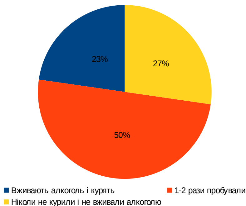
Рис. 3. 2. 4. Результати опитування

компанії, тому це “заняття” залишиться для них актуальним (саме в цьому випадку вже простежується залежність); 11 (50%) — пробували 1-2 рази курити і випивали, проте це їм задоволення не принесло; 6 підлітків (27%) — жодного разу не вживали алкоголю і не курили, оскільки вважають, що це вже “не модно” і наслідки будуть незворотні. Графічно це можна зобразити так (див. рис. 3. 2. 4.):